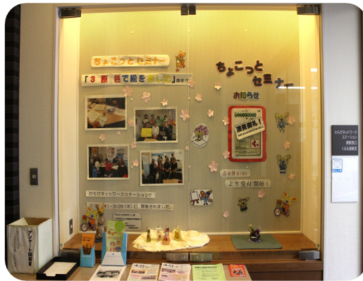
くるる1Fエレベーターホール前 ガラスケース