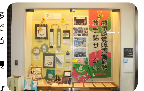
ガラスケース展示の様子

ラミネーターがA3判・A4判ともに1枚50円でご利用できることになりました！ご利用を希望される方は、わらびネットワークステーションまで。