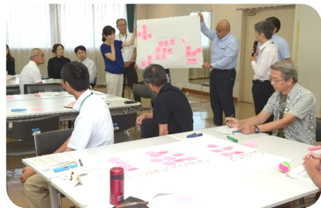
協働のまちづくり研修の様子

令和元年8月29日（木）に福祉・児童センターにて、市民と職員で考える“協働のまちづくり”研修が開催され、市民14名、職員18名が参加しました。