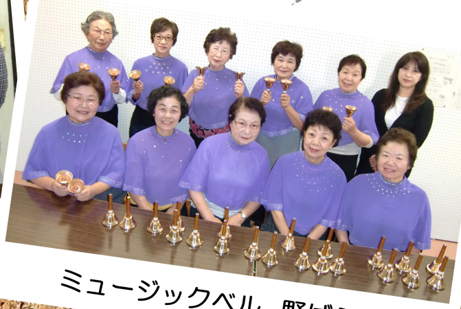
ミュージックベル 野ばら