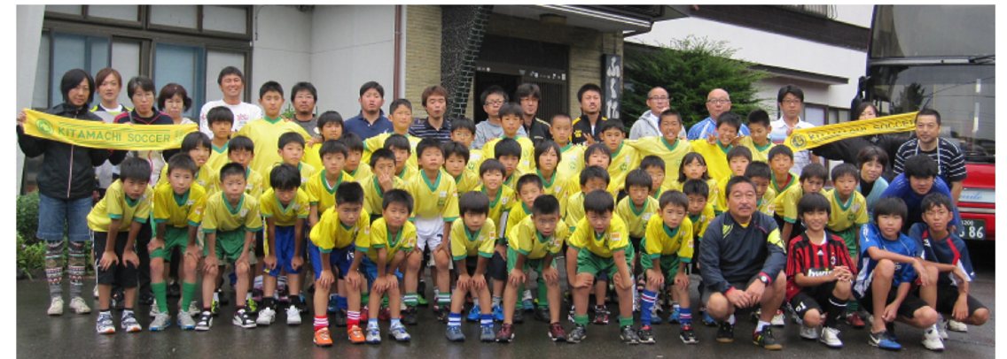
蕨北町サッカースポーツ少年団