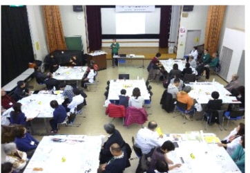
7班に分かれセミナーを受講

昼食は非常食の話聞き、アルファ米の炊き出し体験を行い、午後の「HUG訓練」では避難所開設時にはどのような課題が生まれるのか、またそれにどう対処するのかを模擬体験しました。