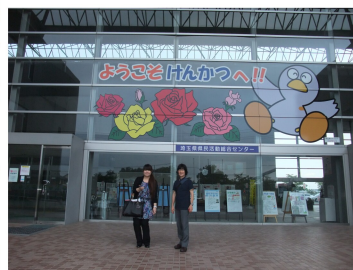
正面玄関前で記念撮影

平成25年9月6日（金）埼玉県民活動総合センターで、県内の市民活動支援組織（市町村市民活動サポートセンター、大学ボランティアセンター等）を対象にした、埼玉県市民活動サポートセンターネットワーク研修会が開催され、わらびネットワークステーションからも2名参加しました。