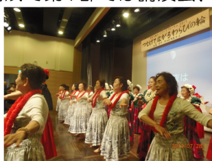
「フラの輪」67名全員で

今回のフォーラムは2部構成で第1部では講演会、第2部では、わらびネットワークステーションでつながった「フラの輪」、ワラビ・ハワイアン・フラ・サークルの設立記念発表会を同時開催しました。