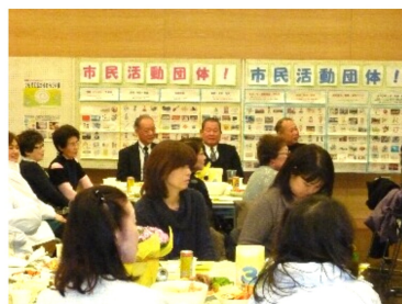
終始和やかムードの会場

市内の登録団体だけではなく、春日部市市民活動サポートセンターの職員も参加していただき、多種多様なジャンルの団体間で交流を深めることができました。