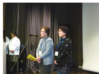
団体の特色を紹介中