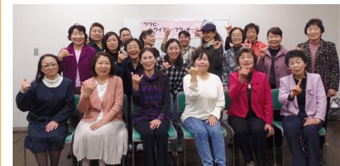
ワラビ・ハワイアン・フラ・サークル参加団体

A.わらびネットワークステーションでは団体からの相談を受け、市民活動団体同士の交流のお手伝いをしています。今、進行しているのは、蕨市内の各フラダンスサークルの交流です。「ワラビ・ハワイアン・フラ・サークル」が、平成25年3月23日に設立し、今後、合同発表会を行う予定です。