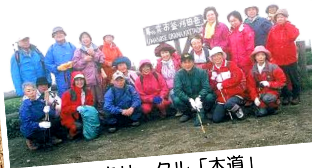
山歩きサークル「木道」