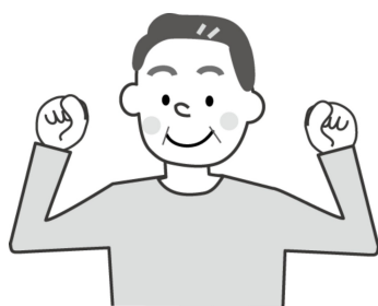
イベントスタッフバンク

例えば… イベント会場整理！ テント設営！ 会場準備、片付け！ など、各種イベントや事業のスタッフとして協力できる方はこちらに登録！