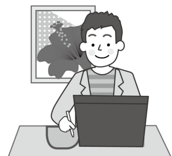
技能者人材バンク

例えば… ピアノ演奏や伴奏で協力したい！ パソコンを使ってイラストやホームページなどの作成の依頼を受けます！ 外国語の通訳ができる！ など、特技や専門的な技能を活かしたい方はこちらに登録！