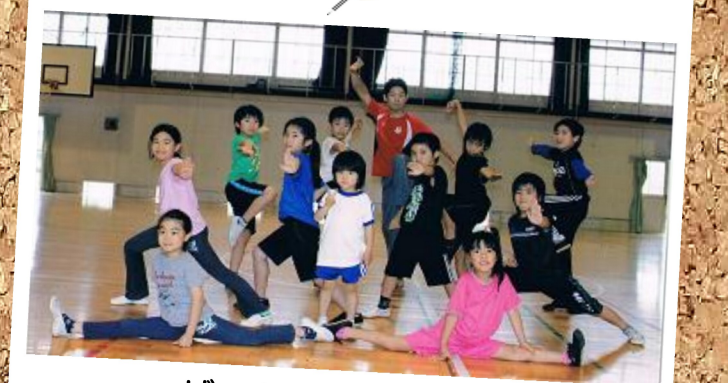
ザ・ドラゴンキッズ