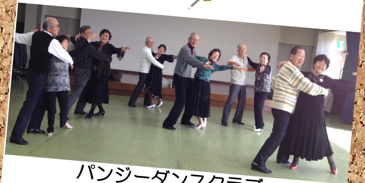
パンジーダンスクラブ