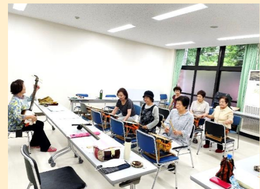
毎週月曜日、北町公民館にて活動中♪ 三味線と太鼓に合わせて民謡を唄います。