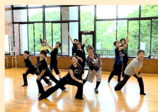
毎週月曜日、中央公民館にて活動中♪ ストレッチ体操とジャズダンス。