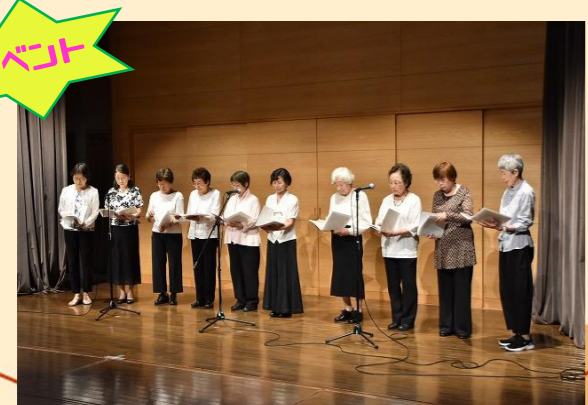
2022.8.18 文化ホールくるるにて。 創立40周年記念朗読発表会を開催。