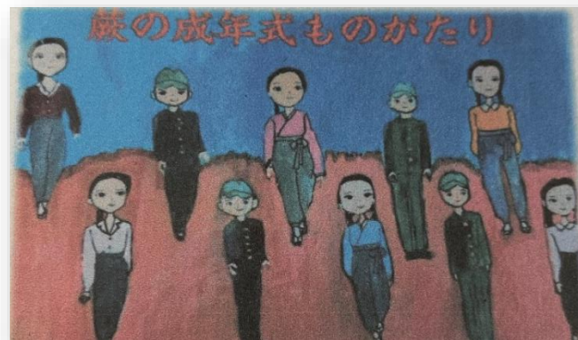
作成した紙芝居「蕨の成年式ものがたり」

『シニア読み聞かせ養成講座』修了生 18名により、発声練習や絵本選びなどお互い刺激しあいつつ、楽しく活動しています。読み聞かせは認知症予防効果もあると言われておりますが、何より子供たちに会うことで元気をもらっています。また、昨年からは市内公民館での平和事業イベントで、私たちが作成した紙芝居『蕨の成年式ものがたり』の上演もしております。この紙芝居は蕨市立第二中学校美術部の生徒さんの絵画をもとに、終戦後の蕨で成年式が誕生するまでの蕨町青年団の活躍を描いた物語です。この紙芝居を通して今後も平和への思いを伝えられる様、活動を続けて行きたいと思っております。