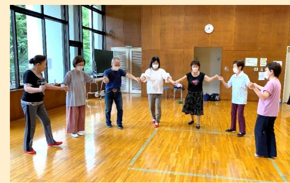
毎週木曜日、中央公民館にて活動中♪ フォークダンスと体操。