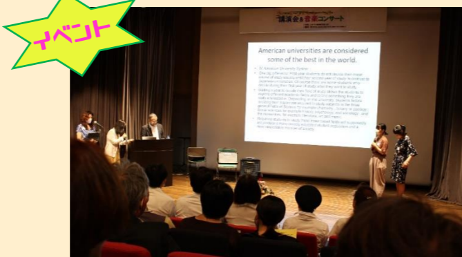
2022.6.26 文化ホールくるるにて。 ILM'ラドとWICAで講演会・コンサートを開催。