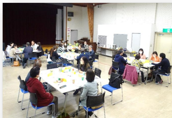
市民活動フォーラム2022参加団体交流会 2023, 4, 9 中央公民館にて

なかでも多かったのは、「活動を広く知ってもらって会員数を増やしたい」というもの。コロナ禍で活動の機会が減る中、会員数も減り、団体全体の元気がなくなっているようです。