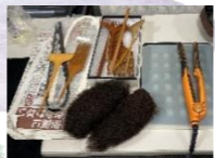
髷ぐし・髷出し・すきげなど