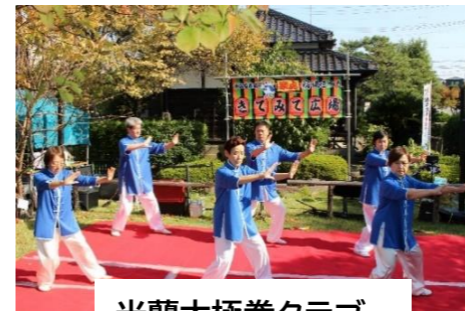
光蘭太極拳クラブ