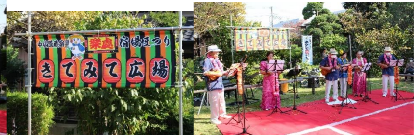
いきがい大学21期 ホア・マハナ

今年も11月3日(金・祝)に宿場まつりが開催されました。今回、宿場まつり実行委員会の「子供からシニアまで楽しめるお祭りにしたい」との思いから、わらび市民ネットにシニア世代(60歳~)の団体を探してほしいとの依頼があり、わらびネットワークステーションの登録団体にもお声掛けさせていただき団体が出演されました。普段は主に室内での活動を行っている団体の方々ですが、快く野外イベントの出演を決めていただき、青空の下で素晴らしいステージをご披露いただきました。